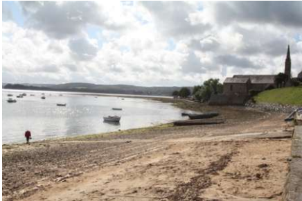
Cimetière des bateaux